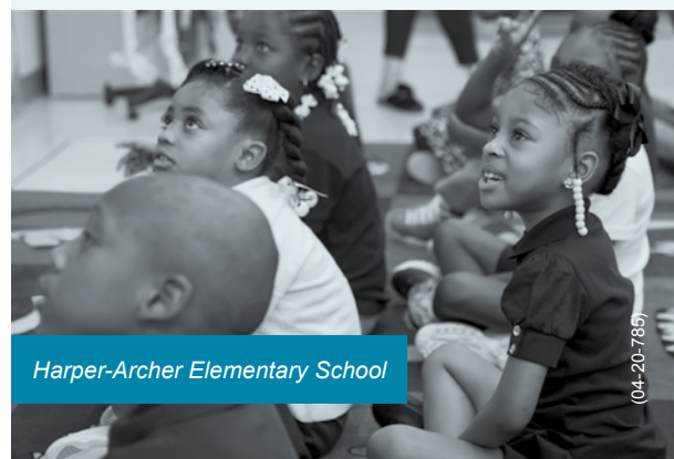
Harper-Archer Elementary School

* Nota: Dependiendo de la cantidad de días de instrucción perdidos por las inclemencias meteorológicas, el tiempo de instrucción puede compensarse con cualquier combinación de días de recuperación, días de aprendizaje virtual o extensiones del día escolar. Visite www.atlantapublicschools.us para obtener las últimas noticias relacionadas con el clima.