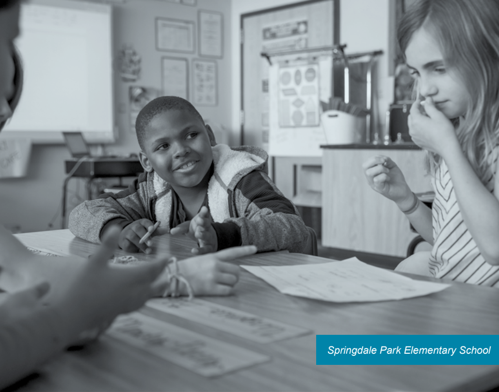
Springdale Park Elementary School

Atlanta Public Schools tiene la misión de asegurar que, con una cultura de cuidado, confianza y colaboración, todos los alumnos se gradúen preparados para la universidad y una carrera profesional.